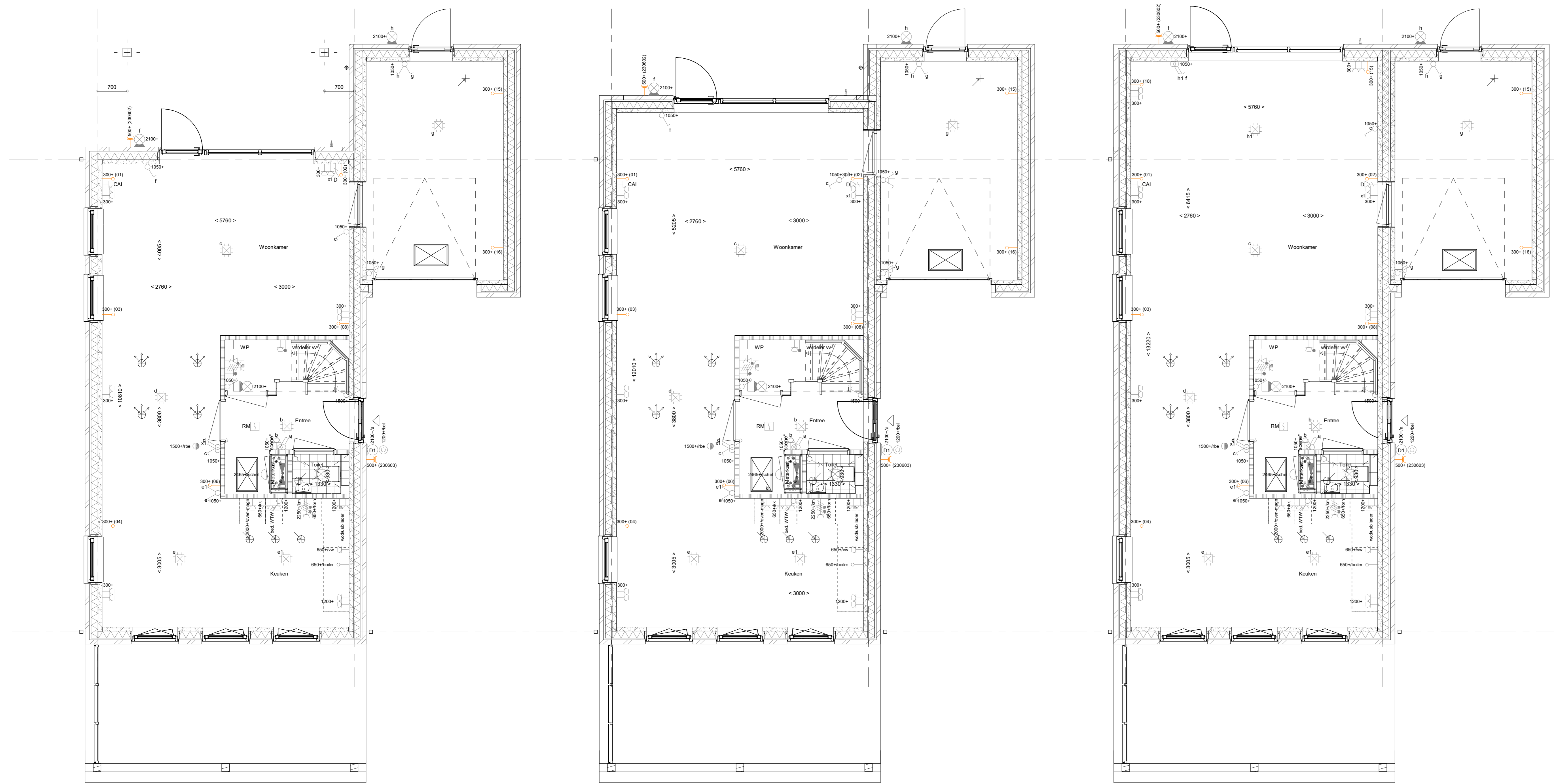
AG5021 - Enkele houten loopdeur met glas in achtergevel gespouwde berging