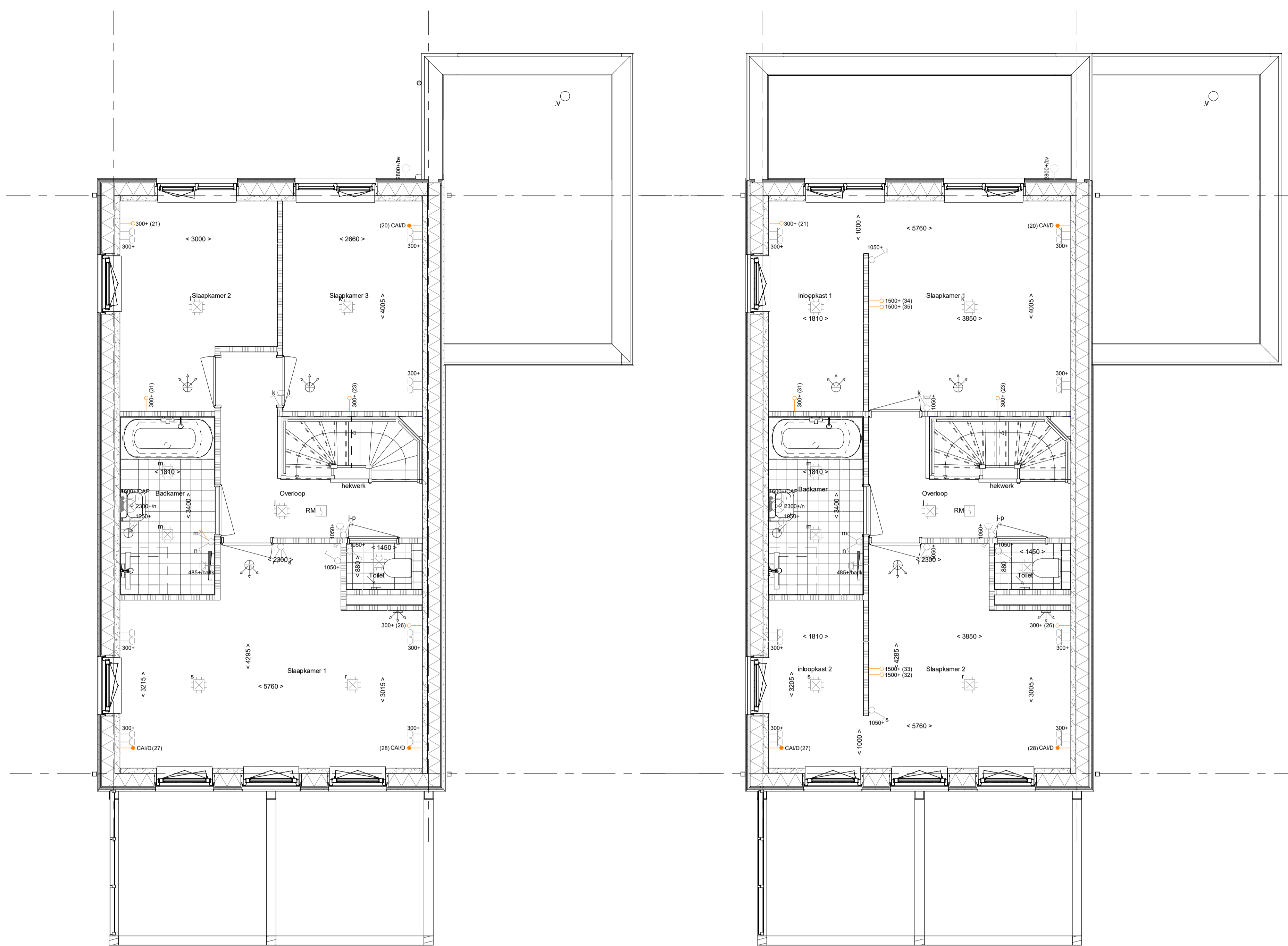
PLS0000 - Spiegelen plattegrond over gehele woning