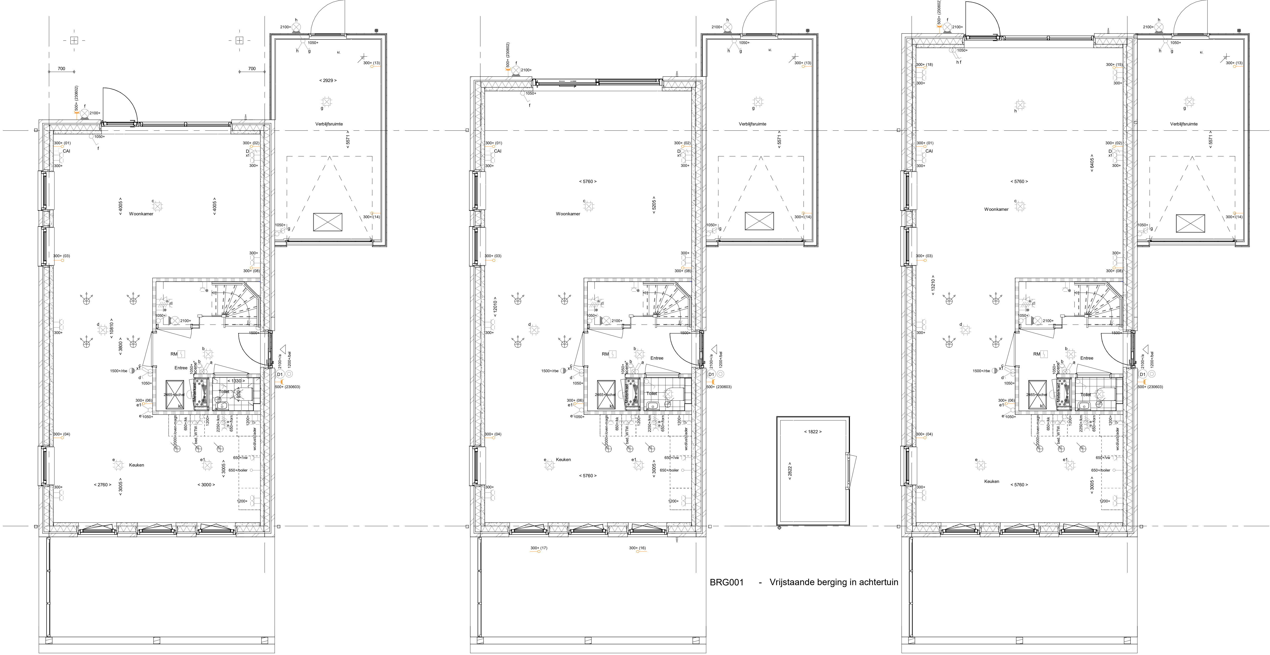
BRG001 - Vrijstaande berging in achtertuin